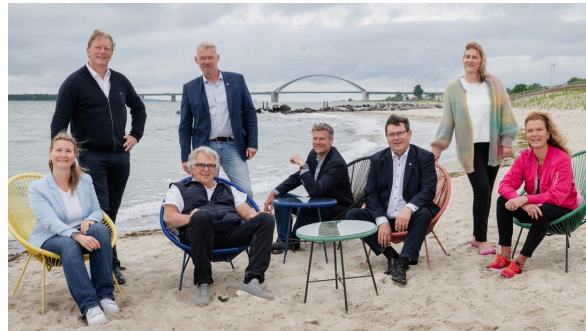
Vorstand und Beirat freuen sich über Ihre Kontaktaufnahme