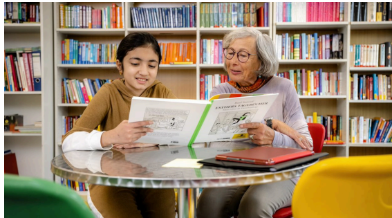
Mentorin im Einsatz

Die Bürgerstiftung Fehmarn wurde am 21.04.2026 gegründet. Unter dem Motto „Von Bürgern für Bürger“ möchte die Stiftung künftig Projekte fördern und umsetzen, die Menschen auf Fehmarn zusammenbringen sowie das Gemeinwohl und generationsübergreifende Solidarität stärken.